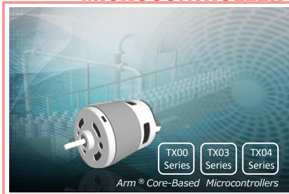
* Arm, Cortexは、米国および/あるいはその他の国におけるArm Limited(またはその子会社)の登録商標です。